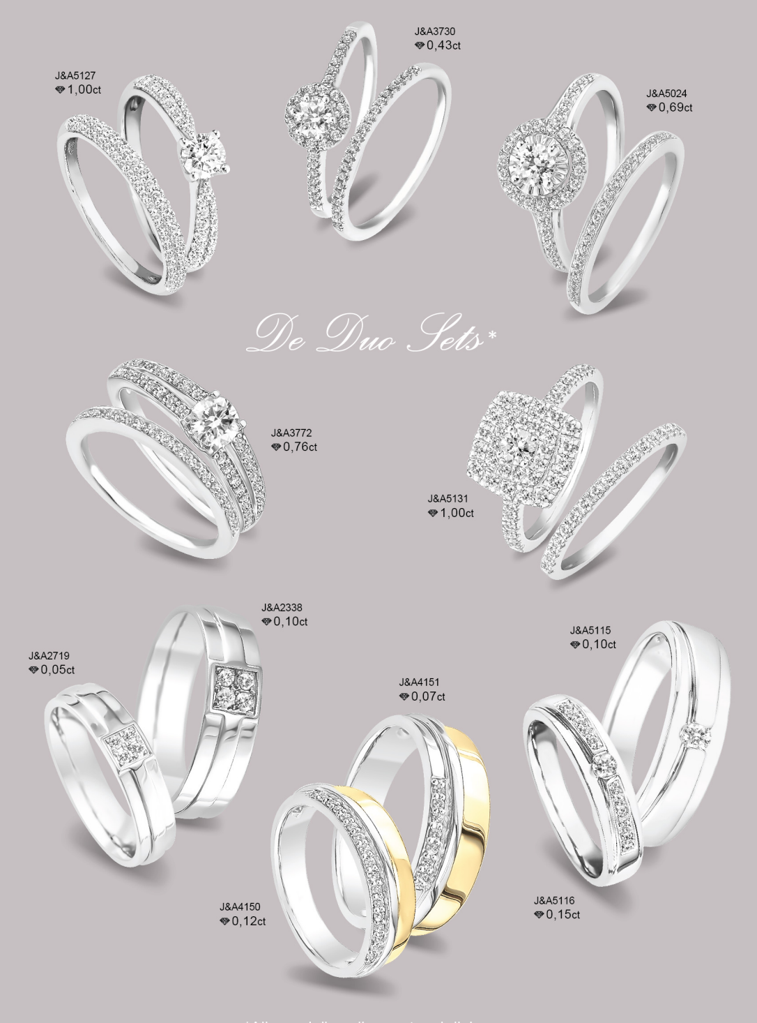
*Alle modellen zijn apart verkrijgbaar